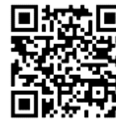
ระบบรับสมัคร